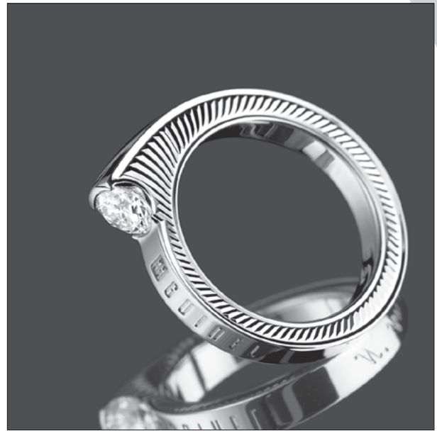
Fig. 4: Le guillochage main fait aujourd'hui un timide retour aux sources avec des applications en bijouterie.