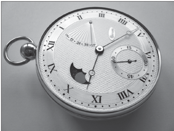
Fig. 3: Le guillochage a été introduit dans l'horlogerie en 1786 par Abraham-Louis Breguet.